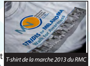
T-shirt de la marche 2013 du RMC

Vous avez le sens de la créativité et de l'esthétique? Vous voulez mettre à l'œuvre votre talent artistique pour une excellente cause? Alors, nous vous invitons à soumettre vos créations au concours de création de t-shirt Strides for Melanoma 2014! Le motif choisi sera imprimé sur des centaines de t-shirts partout au pays et vous recevrez tout le mérite voulu pour votre travail de conception. Le gagnant recevra une carte-cadeau d'une valeur de 100 $ échangeable dans un magasin Future Shop!